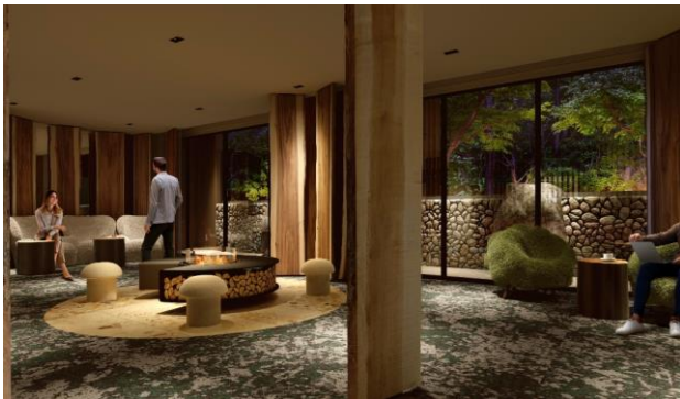
エントランスイメージ

また、サウナ付き温泉大浴場を設け、軽井沢では珍しい温泉を、北軽井沢・応桑温泉からの運び湯を使って楽しめるようにしております。