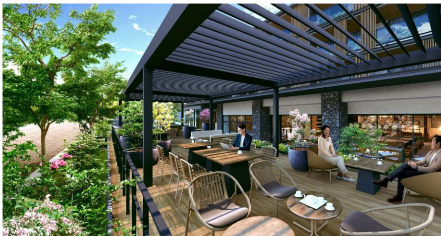
旧軽井沢銀座通り沿いレストランテラスイメージ

本ホテルでは、軽井沢に訪れた人に利用していただけるよう、旧軽井沢銀座通り沿いにレストランテラスを配置しました。本格的なイタリア料理で軽井沢の四季の美味を味わっていただけます。また、旧軽井沢銀座通り沿いの紅葉並木を継承し新たにイロハモミジを植樹することで、食事中も軽井沢の四季折々の変化をお楽しみいただけます。