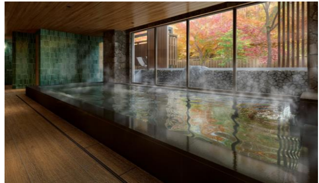
サウナ付き温泉大浴場イメージ