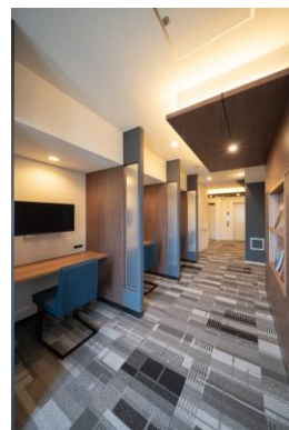
ビジネスラウンジ